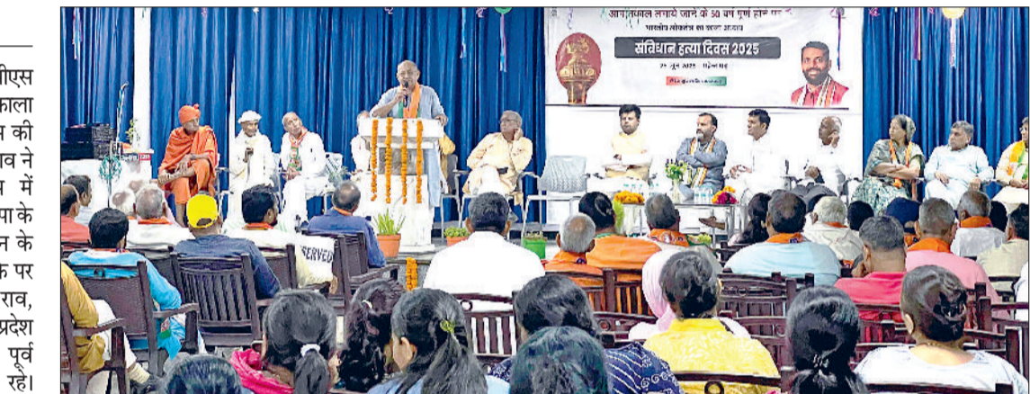
नारनौल। कार्यक्रम को संबोधित करते वक्ता।