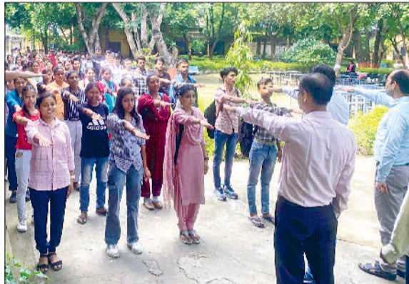
मंडी अटेली। राष्ट्रीय अभियान के तहत विद्यार्थियों को शायत दिलाते हुए।