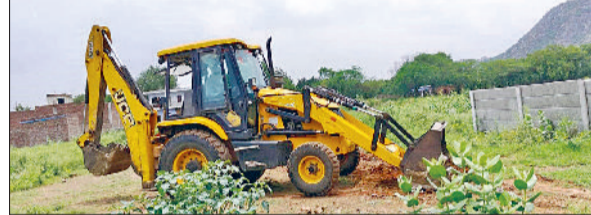
नारनौल। अवैध निर्माण हटाती जैसीबी मशीन।

विधायक कंवर सिंह ने बताया कि वह लंबे समय से इस रोड को लेकर उच्च अधिकारियों के संपर्क में थे। इस बारे में उन्होंने मुख्यमंत्री नारायण चौधरी व पीडब्ल्यूडी मंत्री रणबीर गंगवा से भी गुलाकात की थी। उन्होंने आश्वासन दिया था कि बहुत जल्दी इस रोड को बना दिया जाएगा। बुधवार को इस रोड के टेंडर लग गए हैं और अब बहुत जल्दी इस रोड पर काम शुरू हो जाएगा। विधायक ने बताया कि इस रोड के बनने से दोनों गांव व सतनाली कस्बे से जुड़े गांवों की केंद्रीय विश्वविद्यालय पाली से भी सीधी कनेक्टिविटी हो जाएगी। ये रोड स्टेट हाईवे 148-बी से भी सीधा जुड़ जाएगा। इस से बहुत से लोगों को बहुत अधिक फायदा होगा। हरियाणा में नारायण चौधरी की ओर से जिला महेंद्रगढ़ की सड़कों की हालात जल्दी ही सही होगी। सड़कों के मामले में हमारी सरकार ने बहुत सहायक कार्य किया है। जिससे लोगों को किसी प्रकार की दिक्कत नहीं आने दी है। सड़क बनने पर ग्रामीण अपना काम समय पर कर पाएंगे।