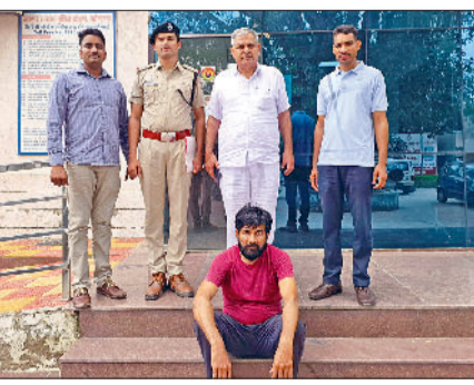
नारनौल। पुलिस गिरफ्तार में आरोपित।

साइबर थाना की पुलिस टीम को गुप्त सूचना प्राप्त हुई कि शहर में एक फर्म के नाम से केनरा बैंक में खुलवाए गए खाते में साइबर फ्रॉड की काफी धनराशि का लेनदेन हुआ है। जिस पर टीम ने मिनिस्ट्री ऑफ होम अफेयर्स के अधीन कार्यरत भारतीय साइबर क्राइम समन्वय केंद्र के समन्वय पोर्टल पर बैंक खाता बारे डिटेल्स सर्च की तो बैंक खाता के खिलाफ विभिन्न राज्यों