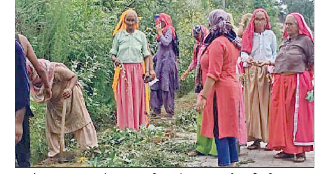
नारनौल। गांव हसनपुर में स्वच्छता अभियान के तहत सफाई करती महिलाएं।