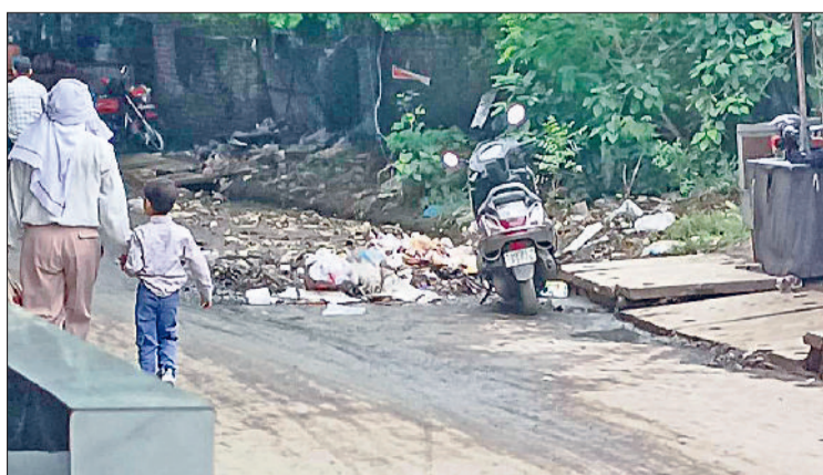
नारनौल। नागरिकों की ओर से नाले में डाला गया कूड़ा।

उपायुक्त डॉ. भारती ने बताया कि शहर के छलक नाले में अभी भी कुछ लोग कूड़ा कचरा फेंक रहे हैं, जिससे गंदगी फैल रही है और जलभराव की स्थिति बन रही है। इसी तरह जिले के अन्य शहरों में भी नागरिक अक्सर नालियों में पॉलीथिन डाल देते हैं। इससे जल निकासी अवरुद्ध होती है। डीसी ने सख्त चेतावनी दी है कि भविष्य में यदि कोई नागरिक नदी नाले या नालियों में