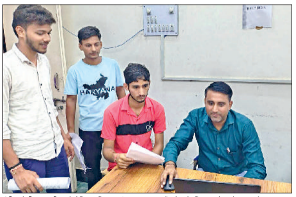
मंडी अटेली। राजकीय औद्योगिक प्रशिक्षण संस्थान सुजापुर में प्रवेश के लिए अपने आवेदन करते हुए।