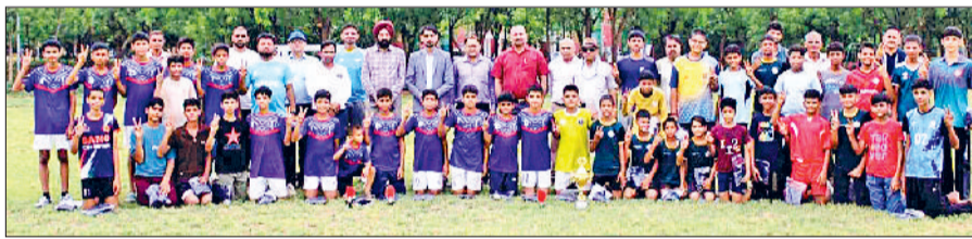
नारनौल। विजेता खिलाड़ियों को सम्मानित करते हुए।