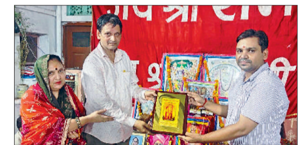
नारनौल। यजमान को स्मृति चिह्न भेंट करते मंडल सदस्य।